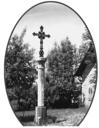
Route de Viuz-mission 1877