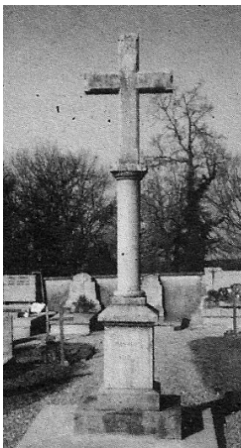
Cimetière- mission 1927