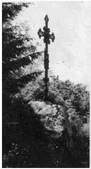
Route du Semnoz-mission 1871